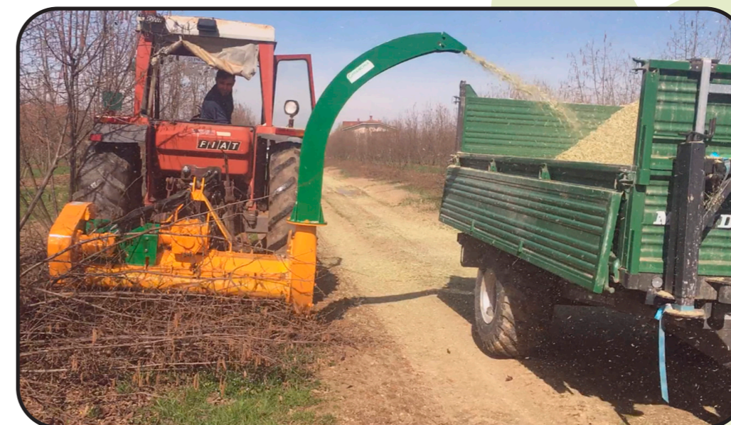
▶ Tobera alta