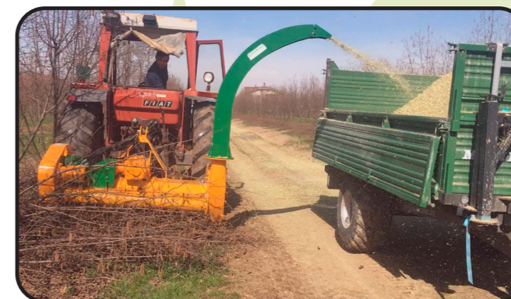
▶ Tobera alta